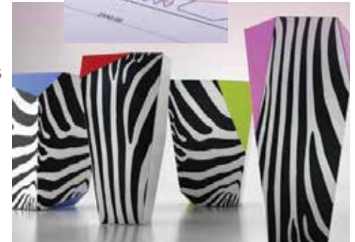
Llega de manera plana. Arme. Desarme. Repita