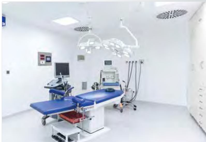
Proyecto: Sala de parto

PALCLAD Pro está disponible con acabados lustrosos y mate.