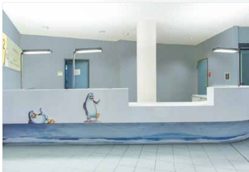
Project: Hospital de Niños